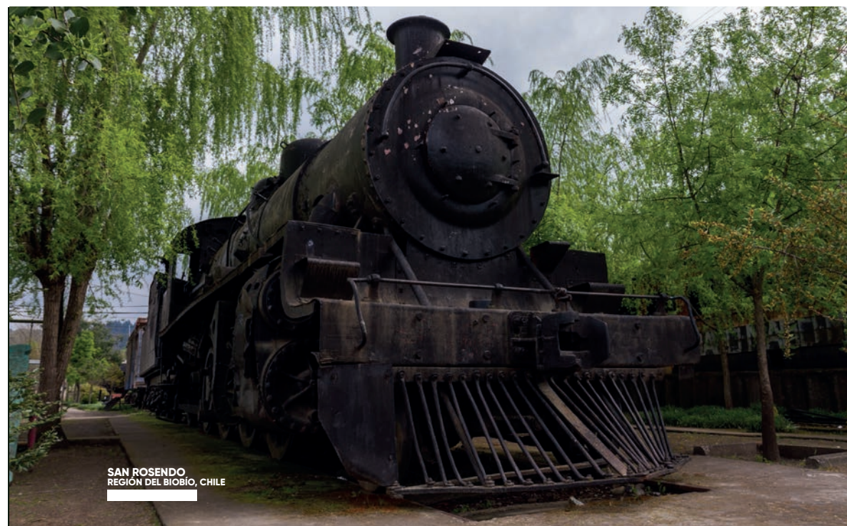
SAN ROSENDO REGIÓN DEL BÍO-BÍO, CHILE

Este poblado fue el epicentro del paso del ferrocarril, ya que abastecía de carbón y agua a todas las locomotoras a vapor que cruzaban este lugar, siendo un cruce estratégico entre el norte y el sur del país. Hoy sólo quedan las ruinas de una época de esplendor, pero aún se puede ver lo que fue la Casa de Máquinas, con una capacidad para 36 locomotoras bajo techo en hangares. Su principal función era proveer de locomotoras a casi todos los trenes de pasajeros y carga que recorrían la zona entre Talca y Victoria, con una tornamesa que permitía invertir el sentido de las locomotoras o guardarlas bajo techo. Aquí también podrás ver los restos de La Carbonera Mecanizada, depósito que contenía el carbón, que entonces era usado como combustible para propulsar el tráfico ferroviario. Almacenaba hasta 450 toneladas del mineral y podía abastecer hasta ocho locomotoras simultáneamente por ocho mangas. Sólo existieron tres en Chile. También en San Rosendo, no dejes de ver dos locomotoras a vapor que son Monumentos Históricos: la N°708 y la N°802, ambas fabricadas en EE.UU. a principios del siglo XX.