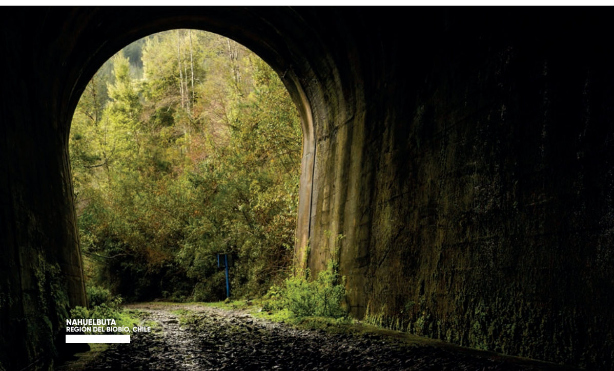
NAHUEL BUTA REGIÓN DEL BÍO-BÍO, CHILE

En 1908 se decidió construir un nuevo ramal ferroviario, que uniera los poblados de Lebu con Los Sauces. Si bien existía otro ramal cercano por la costa, para el Estado era un tema prioritario y estratégico poder sacar el preciado carbón desde Lebu por el interior, ante la posibilidad de un ataque bélico desde el mar y que el país quedara desabastecido del mineral. El gran problema era cómo cruzar la cordillera de Nahuelbuta. Las dificultades de la geografía y la sucesiva quiebra de las empresas que intentaban concluir la tarea, terminaron con el Estado comprando la compañía y dando fin al trazado recién en 1939. Los trenes debían sortear pendientes y cinco túneles en la cordillera: Contulmo, Huiña, Sanzana, Licahue y Nahuelbuta, además de un túnel antes de llegar al puerto de Lebu. El tren dejó de pasar en la década del 80, pero estas obras viales aún puedes conocerlas por dentro junto a guías especializados, que te contarán, por ejemplo, el temor de los conductores de quedar atrapados al pasar por las dos curvas del túnel Sanzana, o que debían recorrer a apenas 5 km/h los 990 metros del túnel Nahuelbuta.