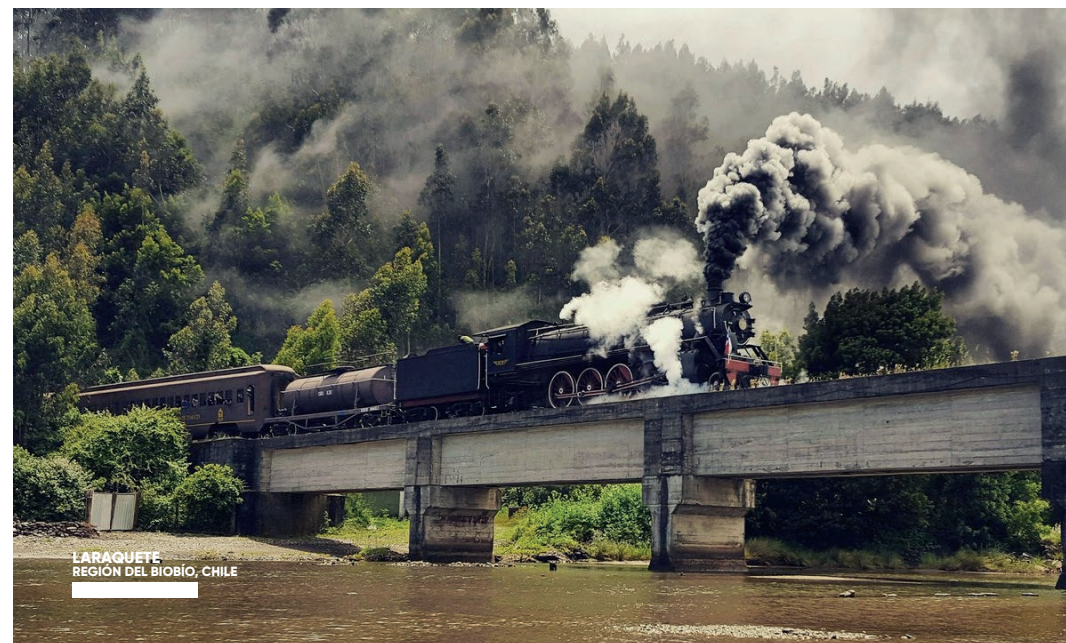
LARAQUETE REGIÓN DEL BIOBÍO, CHILE