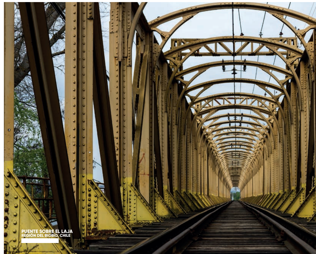
PUENTE SOBRE EL LAJA REGIÓN DEL BIOBÍO, CHILE

Tras cuatro décadas de ausencia, volvió el tren a vapor desde Concepción a Laraquete, en un viaje evocativo y lleno de historia, por hermosos paisajes costeros que llevan hasta el sur de Lota. Está de vuelta como un tren turístico, tras el éxito de la iniciativa del Corto Laja, y tiene directa repercusión en el turismo al incentivar la producción local de "palomitas", restaurantes y artesanos locales, quienes se encargaron de recibir y atender a los pasajeros en la estación de Laraquete.